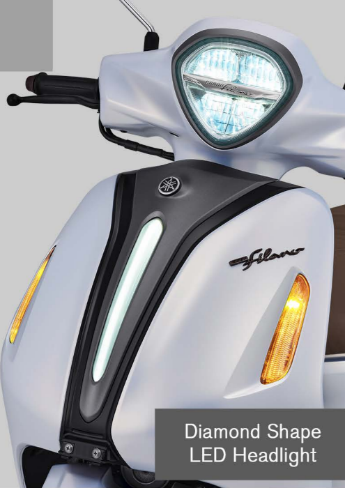
Diamond Shape LED Headlight