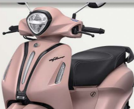
Neo | Pink Mauve