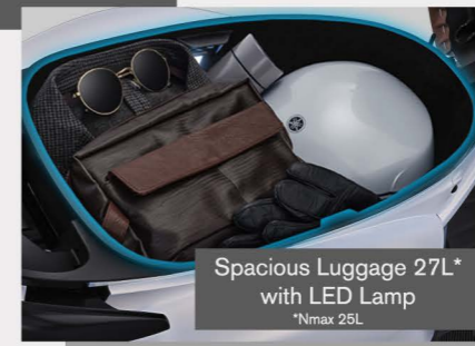
Spacious Luggage 27L* with LED Lamp *Nmax 25L