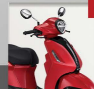
Neo | Red