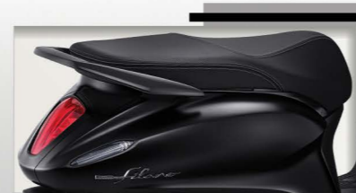
Neo | Matte Black