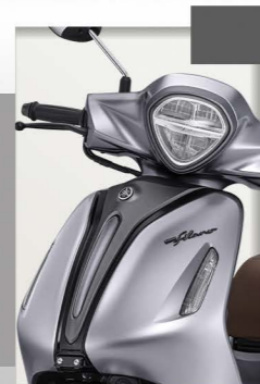
Lux | Dark Silver