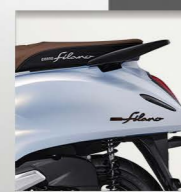
Lux | White Pearl

*Spesifikasi dapat berubah sewaktu-waktu tanpa pemberitahuan terlebih dahulu guna peningkatan mutu sepeda motor Yamaha