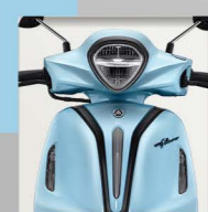
Neo | Dull Blue