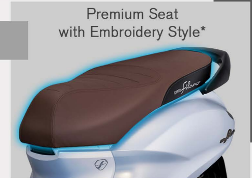
Premium Seat with Embroidery Style*