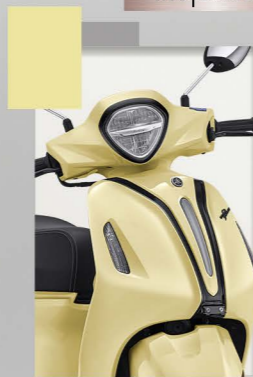
Neo | Yellow